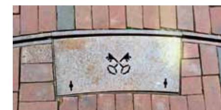
Uitgefreesde sleutels verwijzen naar het stadswapen van Leiden.

Het contrast tussen de intieme singelrand en het plein is groot. Hier wordt duidelijk dat er stevig is onderhandeld tussen de Vrienden van het Singelpark, die zo veel mogelijk groen willen, en de kermisexploitanten die voldoende ruimte nodig hebben voor hun kramen en attracties. Ondanks de hoge ambities in het beeldkwaliteitsplan lukte het de kermisexploitanten om tijdens de vele participatierondes de nodige