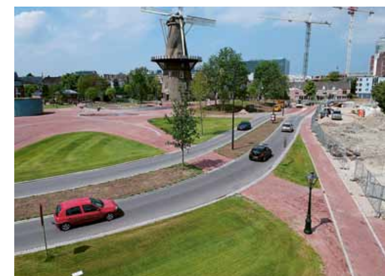
De rode baksteen van het plein is doorgetrokken over de drukke Molenwerf en markeert zo de voetgangersroute.