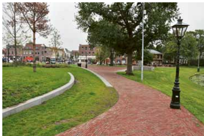
De groene rand langs de singel heeft een tuinachtig karakter.