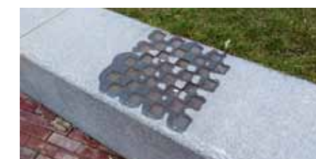
In de stenen randen van de grastribunes zijn schaakborden gemaakt.

Het ontwerp van Marseille Buiten voor de Lammermarkt. Het plan bevat vier onderdelen: de waterkant aan de noordzijde, de terp met de molen, het plein zelf en de entree van de parkeergarage in het zuiden.